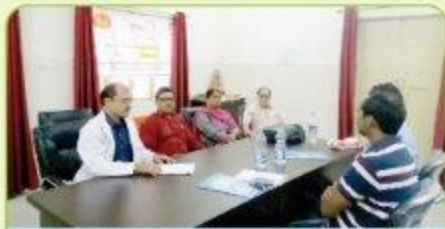
Review Meeting of Hausala Training Center by District Authorities

मेडिकल कालेजों में विभिन्न स्तर के प्रशिक्षकों को परिवार नियोजन तकनीक में प्रशिक्षित किया गया ताकि उच्च गुणवत्ता वाली तकनीक और क्लीनिकल कौशल को शैक्षणिक संस्थानों से मंडलीय प्रशिक्षण केन्द्रों तक पहुँचाया जा सके। इन प्रशिक्षण केन्द्रों पर प्रशिक्षकों की उपलब्धता सुनिश्चित करने के लिए चिकित्सकों को विशिष्ट प्रशिक्षण जैसे प्रोपेड्युसिक, मिनीलेप नसबंदी तकनीक, बिना स्पर्श आई.यू.सी.डी. तकनीक और पी.पी.आई.यू.सी.डी. तकनीक प्रदान किये गये। इन 10 केन्द्रों में सफलतापूर्वक विभिन्न प्रशिक्षणों को इस उद्देश्य की पूर्ति हेतु संचालित किया गया जिससे कि हर विकास खण्ड पर एक महिला नसबंदी के लिए प्रशिक्षित सेवा प्रदाता तथा हर उपकेन्द्र पर एक आई.यू.सी.डी. सेवा प्रदाता उपलब्ध हो सके। इन्डक्शन प्रशिक्षण की श्रृंखला द्वारा डाक्टर और स्टाफ नर्सों को मिनीलेप, लैप्रो, आई.यू.सी.डी. और पी.पी.आई.यू.सी.डी. तकनीक में प्रशिक्षित किया गया, जिससे सेवा प्रदाताओं का एक बड़ा पूल बनाने में सफलता प्राप्त हुई। इन केन्द्रों की स्थापना के बाद से अभी तक करीब 4000 से अधिक डॉक्टर और सहयोगी स्टाफ विभिन्न परिवार नियोजन तकनीक में प्रशिक्षित किये गये हैं।