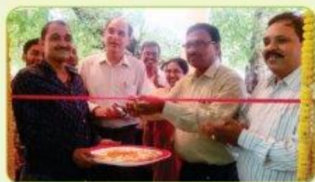
Inauguration by District Magistrate and Additional Director of HTC