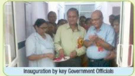
Inauguration by key Government Officials

किया। सिफसा राज्य के लिए एफ.पी.2020 लक्ष्यों की पूर्ति हेतु विकासशील भागीदारों जैसे पी0एस0आई0, एम.एस. आई. और एच.एल.एफ.पी.पी.टी. के सहयोग से निजी क्षेत्र के चिकित्सकों के प्रशिक्षण की आवश्यकता को भी पूर्ण कर रही है।