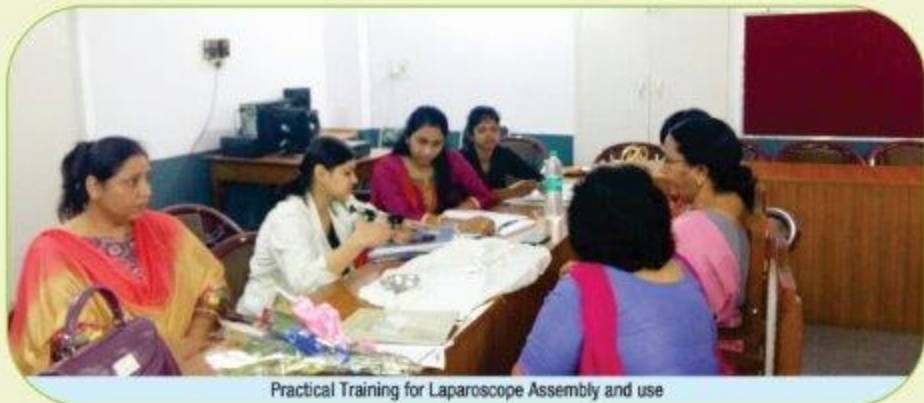
Practical Training for Laparoscope Assembly and use

भारत सरकार ने हाल ही में तीन नए गर्भनिरोधक विधियों जैसे इन्जेक्टैबल, प्रोजेस्ट्रान केबल गोलियों और सेन्क्रोमान को शामिल किया गया है और इनकी निःशुल्क आपूर्ति वर्ष 2016-17 में होने की सम्भावना है। अन्य प्रशिक्षणों के अतिरिक्त, हौसला प्रशिक्षण केन्द्र (एच.टी.सी.) नए गर्भ निरोधकों के तरीकों पर सेवा प्रदाताओं (डॉक्टर, स्टाफ नर्स व ए.एन.एम.) की क्षमता निर्माण के लिए भी ध्यान केंद्रित करेगी। साथ ही विभिन्न प्रकार के सेवा प्रदाताओं में व्यापक जानकारी तथा समुचित सेवा प्रदान करने के लिए ए.एन.एम. और स्टाफ नर्स के प्रशिक्षण को गति प्रदान करने का प्रयास