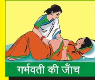
गर्भवती की जाँच