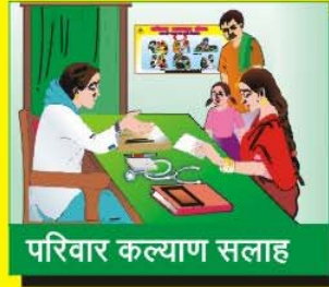
परिवार कल्याण सलाह