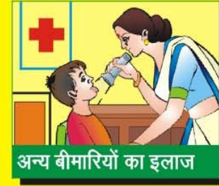
अन्य बीमारियों का इलाज

अधिक जानकारी के लिए अपने पास के सरकारी अस्पताल से सम्पर्क करें।